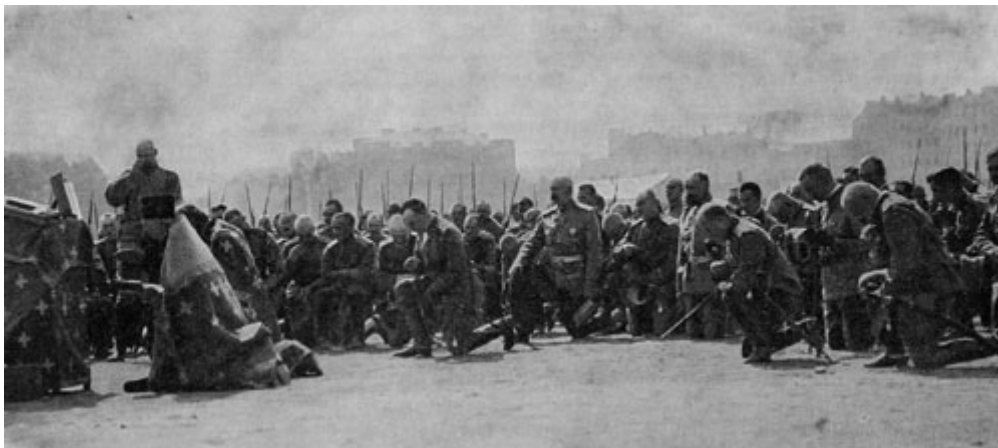
Фото А.Оцупа “Молебен перед выступлением в поход” 1 , а фактически — “благословение” паствы, обречённой политикой режима Николая II большей частью на убой без какой-либо пользы для развития России.

влез по неумелости на царстве в японско-русскую войну, так воздержись от новой войны. И будто не было в жизни Николая Матильды Кшесинской, добрачная половая связь с которой была инициирована — вопреки нормам человеческой морали и учению РПЦ о блуде и таинстве брака — ни кем иным, как ещё одним кандидатом в святые — Александром III (миротворцем). И в политике Николая, не понапрасну получившего от народа прозвище «кровавый», РПЦ соучаствовала, благословляя всё: