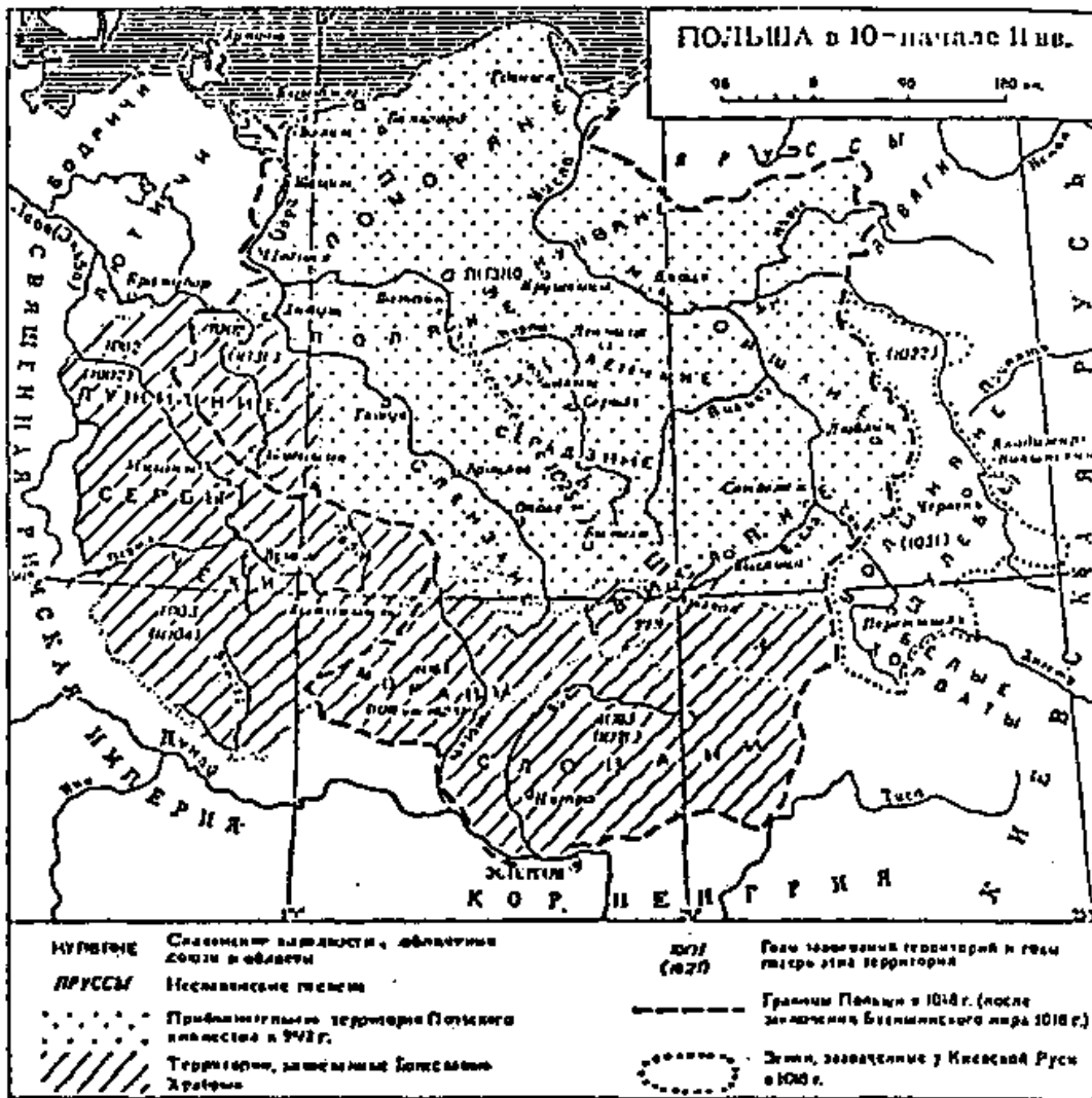
Рис. 3. Польша в 10 - начале 11 вв.

Следует отметить, что с I-го до IX века между бодричами, лютичами, поморянами, мазовшанами, полянами балтийскими, куявянами, ленчанами, полочанами, ильменскими словенцами, кривичами, меря, ситскарями (сицкарями), голядью балтийской, дреговичами, древлянами, северянами, радимичами, вятичами, полянами днепровскими, уличами, тиверцами, вислянами, волянынами (дулебами) и серадзянами различных этнических не было. Они не были племенами. Это был единый венедский, а позже русский народ с III-го века н.э.